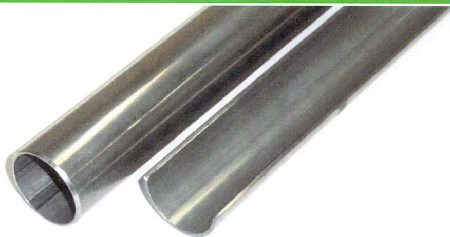
内面(パイプカット)